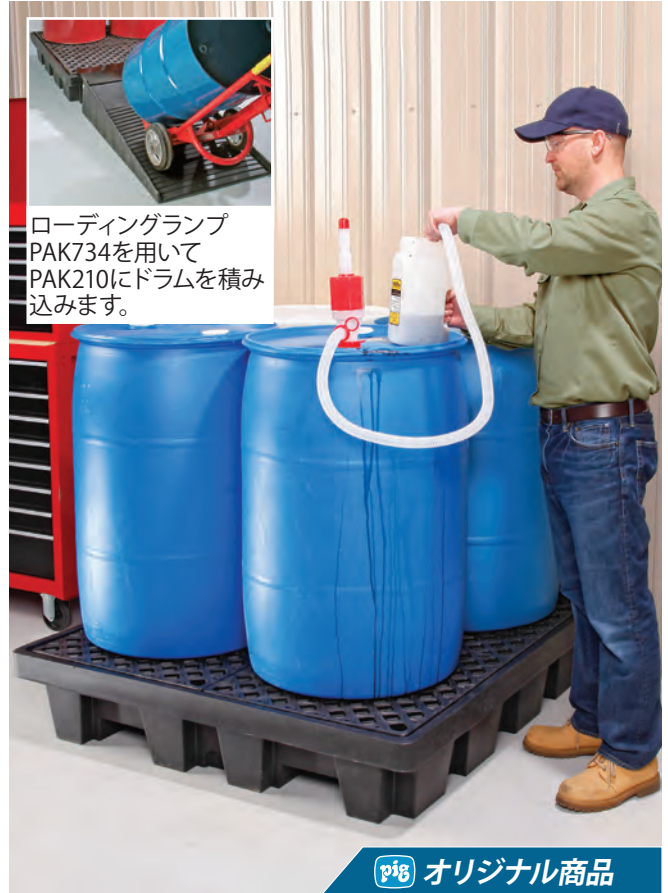
ローディングランプ PAK734を用いて PAK210にドラムを積み込みます。