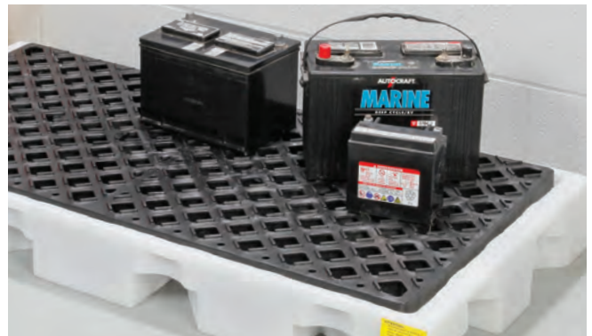
デッキはバッテリーの保管に最適です。

注記：本製品を可燃性液体とともに使用する場合は、可燃性液体の保管および取り扱いに関する規制、および本用途の安全性、特に可燃性蒸気、静電放電、および熱源を考慮してください。